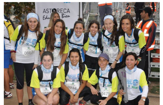
Parte del equipo Astoreca que participó en la competencia.